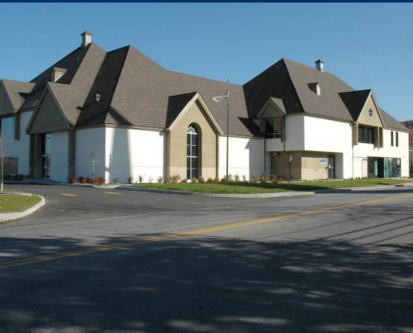
Musée du Fjord, La Baie