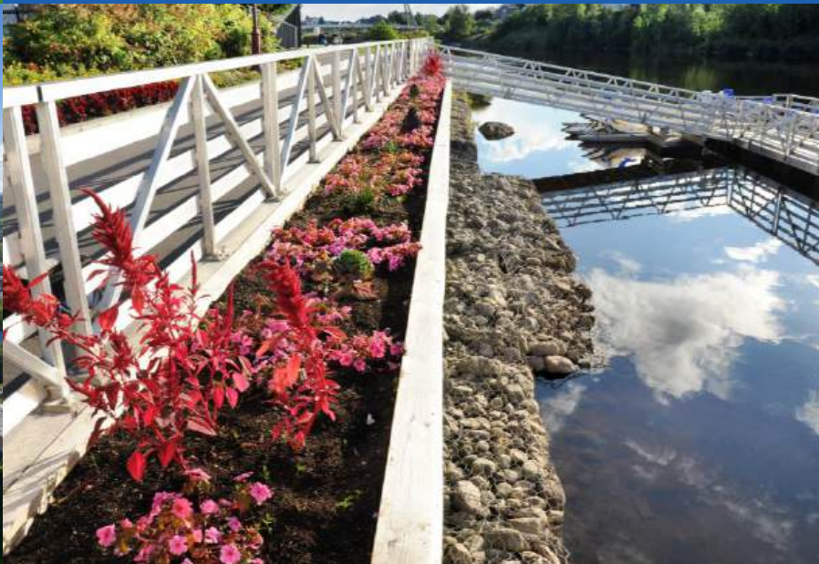
Parc de la Rivière-aux-Sables, Jonquière