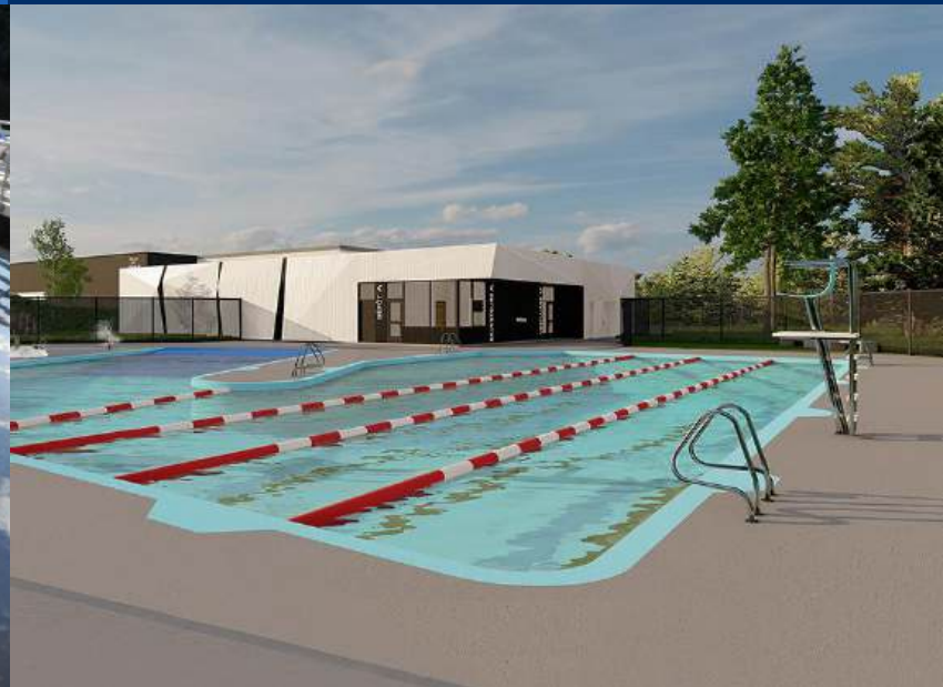
Piscine du parc de la Colline, Chicoutimi