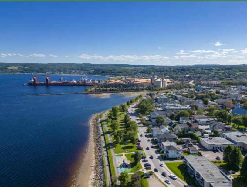
Parc de la Consol, La Baie